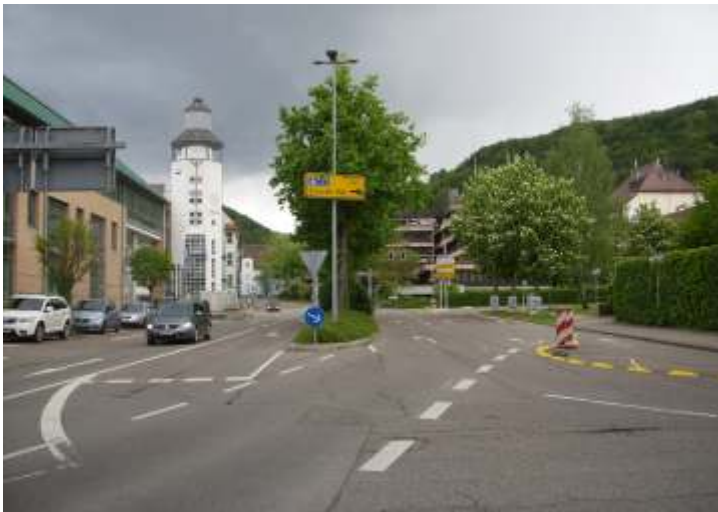
Ein Kreisverkehr vor dem Rathaus wäre eine runde Sache