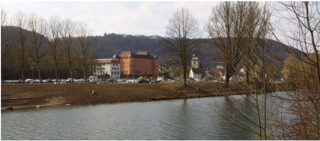
Eines der Großprojekte in Künzelsau: Seit Monaten sind die Bagger im Einsatz, um die Wertwiesen neu zu gestalten. Ein Planungsziel im Rahmen von „Stadt am Fluß“ ist, Sichtachsen auf das Schloß und die Gebäude der Innenstadt zu schaffen.